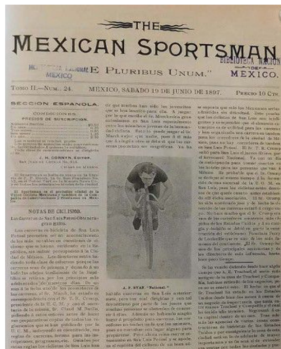
El "Mexican Sportsman," la primera publicación deportiva exclusiva en México.

Simultáneamente, el Reforma Athletic Club, nacido en el mismo año, emergía como una institución decana en el