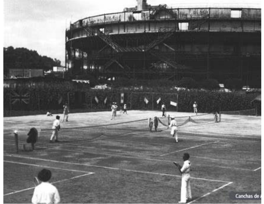
Canchas de Arcilla para practicar el tenis.