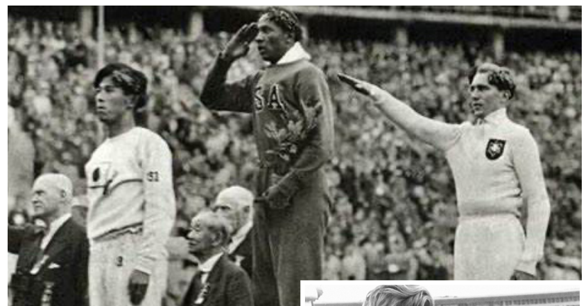
Jesse Owen, la leyenda.

Solidaridad olímpica entre el alemán Luz Long y el estadounidense Jesse Owen.