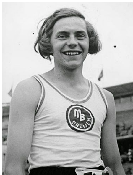
El caso de Heinrich "Dora" Ratjen quedó en los anales de la historia de los JO.

En septiembre de 1938, fue denunciado como resultado de un incidente en una estación de trenes y sometido a exámenes médicos que confirmaron su biología masculina. Se le acusó de fraude, y sus reconocimientos y premios fueron confiscados. Tras el escándalo, vivió como hombre, sirvió en el ejército y trabajó como camarero en Hamburgo y Bremen hasta su muerte en 2008.