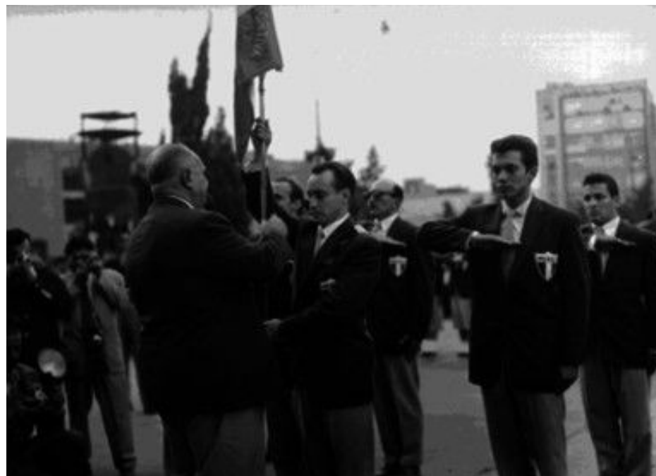
Joaquín Capilla abanderado de la delegación mexicana.