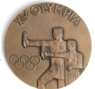
Medallas de Helsinki 1952.

Capilla, el abanderado y medallista: El clavadista Joaquín Capilla Pérez tuvo el honor de abanderar a la delegación mexicana en el desfile inaugural. A pesar de haberse fracturado la mano durante un entrenamiento, Capilla logró la medalla de plata en la plataforma de 10 metros, convirtiéndose en el primer atleta mexicano en ganar medallas en dos Juegos Olímpicos consecutivos