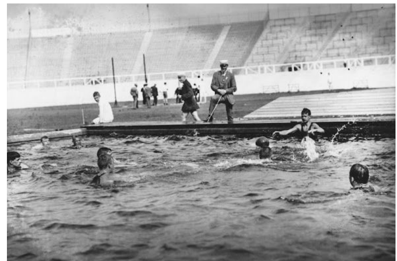
El estadio albergó la mayoría de las competencias, incluida la natación, que se realizó en una piscina dentro del recinto.