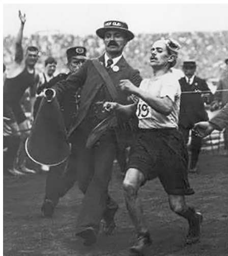
Dorando Pietri llegó exhausto y desorientado al estadio, y fue ayudado por los jueces a cruzar la meta.

El primer estadio olímpico: Por primera vez, se construyó un estadio exclusivamente para los Juegos, con capacidad para 68.000 espectadores. El estadio albergó la mayoría de las competencias, incluida la natación, que se realizó en una piscina dentro del recinto.