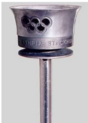
Antorcha Olímpica Estocolmo-1956.