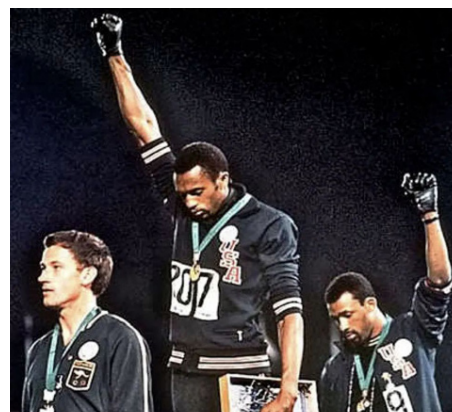
Tommie Smith y John Carlos.