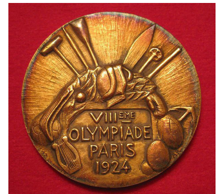
Muestra de la Medalla que se usó en los JO de 1924.