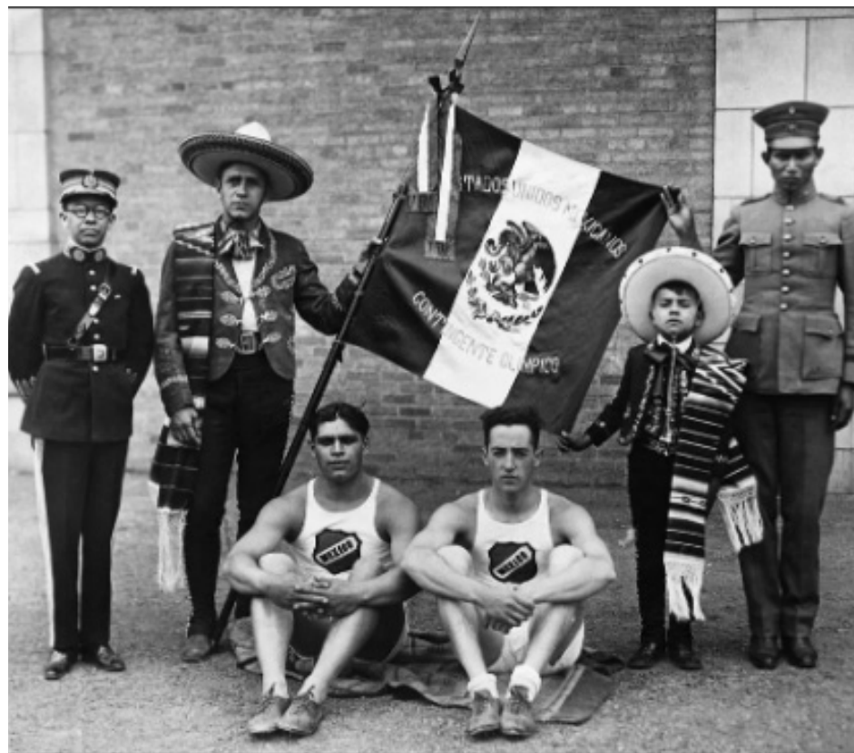
Atletas mexicanos antes de partir a la aventura olímpica.

En este período, deportes populares como el boxeo y el béisbol no formaban parte de los Juegos Olímpicos debido a su carácter profesional. La rigidez del amateurismo, fundamental en aquel entonces, encontraba su máxima expresión en el atletismo, aunque se participó en tenis y tiro, dos deportes propios de las clases altas.