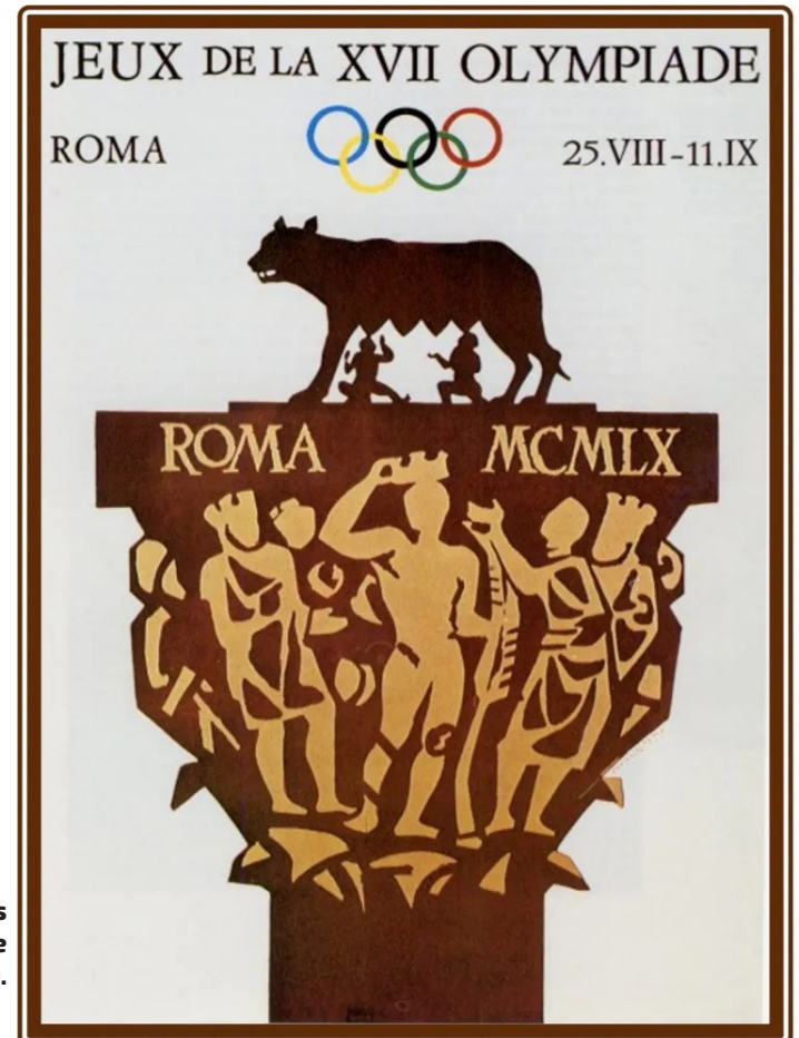
El cartel de los Juegos Olímpicos de Roma 1960.

nar la maratón corriendo descalzo. En el ring, un joven Cassius Clay, más tarde conocido como Muhammad Ali, ganó el oro en boxeo, iniciando su legendaria carrera.