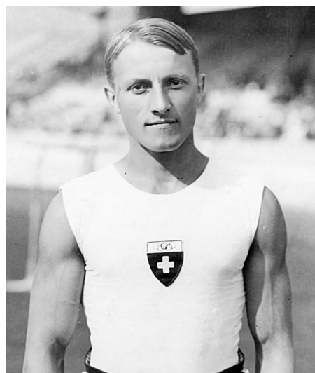
Anton Heida de EU ganó 7 preseas en la disciplina de gimnasia artística.

En este caso se observa como el anfitrión incluye un deporte extraño, el llamado Roque, considerado una versión estadounidense del llamado Roquet inglés. Se consolida el Atletismo como un deporte muy practicado y otorga 82 medallas. Repite en el programa de estos Juegos la llamada Cinchada. Las variaciones en deportes entre estos tres primeros juegos, permite considerar que no existía aún un programa oficial de eventos.